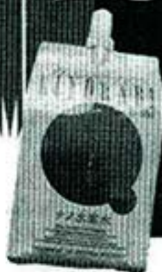
アルミパウチ容器に入った「KIYORABI」